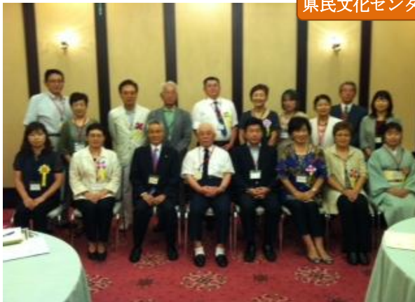
県民文化センター 5F ルビーの間

明珠在掌(めいしゅ たなごころにあり)、皆さんの一人おひとりがそうです。先ずは おめでとうございます。